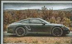
PORSCHE'S NEW 911 เจ้าชายของคัลเลอร์ รัชทายาทแห่งราชวงศ์ 911