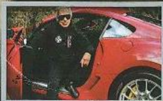
RALPH LAUREN'S CAR COLLECTION ชุดรถของยอดดีไซเนอร์