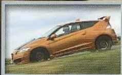
HONDA CR-Z MUGEN ฮอนดาเจ็ทเมือมริคคันแรกของโลกจากค่าย HONDA