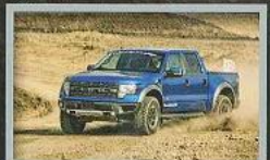
TEXAS GP CIRCUIT สนามทรงปรี๊ดสุดอลังการสนามแรกของสหรัฐฯ อเมริกา