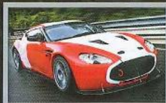
ASTON ZAGATO COACHBUILT RACER แฟดซ่าลัม 'กรีนเฮล'